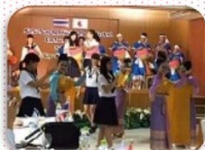
愛知県高校生代表の1人として タイ・バンコクで現地生と交流！