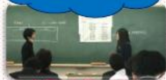
英語で会話しよう！