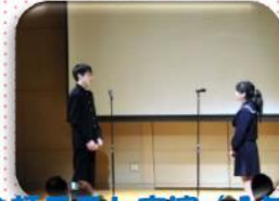
会話テスト実演（1年生）

また、本校からタイ・バンコク都に派遣された生徒も、 派遣団の1人として報告を行いました。