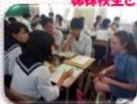
英語で日本文化紹介