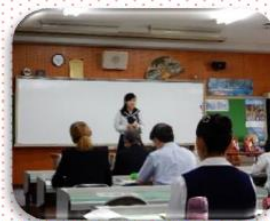
英語スピーチコンテストに チャレンジ！！