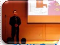
プレゼンテーション実演（2年生）

平成28年12月26日に行われたイングリッシュフォーラムにて、 本校での英語教育の取組を発表しました。