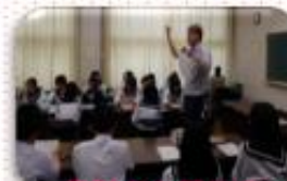
常駐ALTとの 授業も豊富