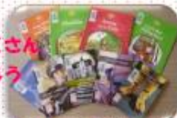
Oxford Big Readにチャレンジ！ 2016年には優秀賞を受賞しました！！